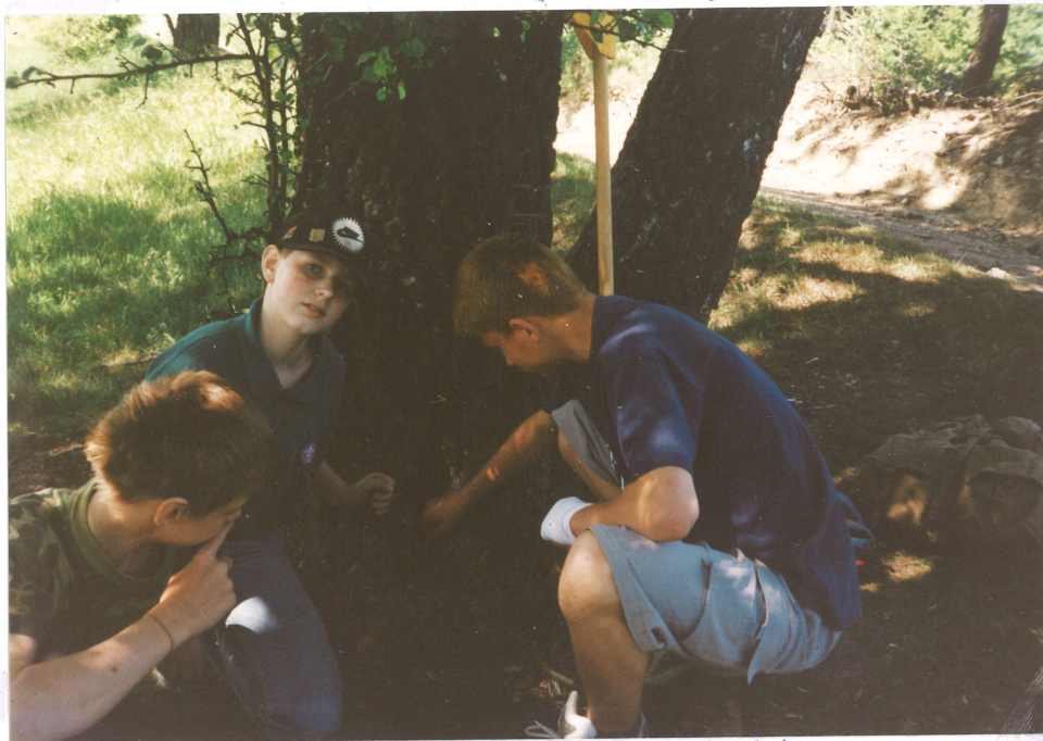
Zakopávání Jestřábi Listiny na vrcholu Vartovny