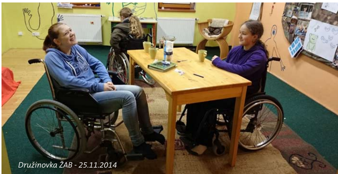
Družinovka ŽAB - 25.11.2014