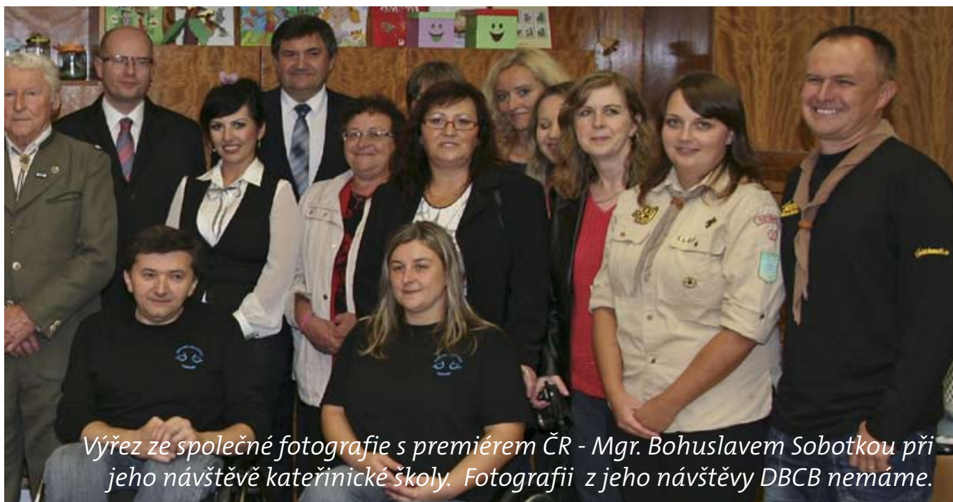
Výřez ze společné fotografie s premiérem ČR - Mgr. Bohuslavem Sobotkou při jeho návštěvě kateřinické školy. Fotografii z jeho návštěvy DBCB nemáme.