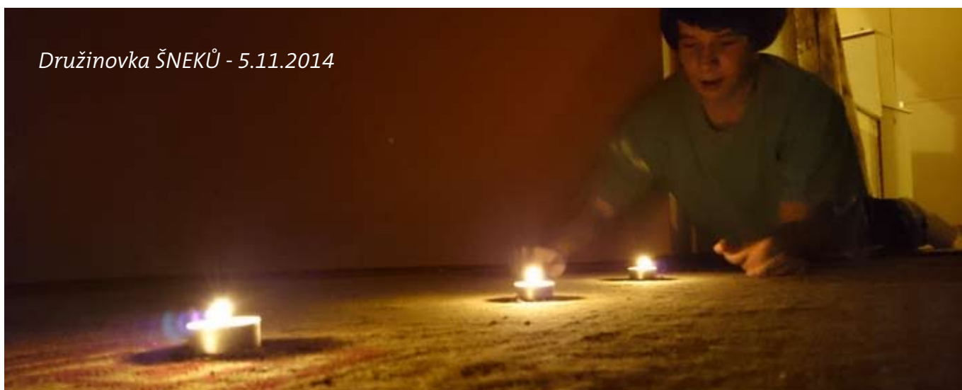
Družinovka ŠNEKŮ - 5.11.2014