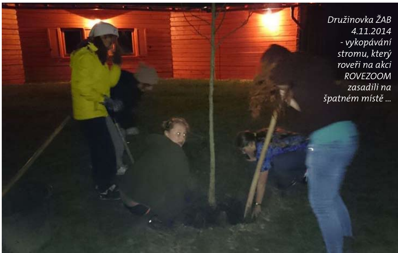
Družinovka ŽAB 4.11.2014 - vykopávání stromu, který roveři na akci ROVEZOOM zasadili na špatném místě ...