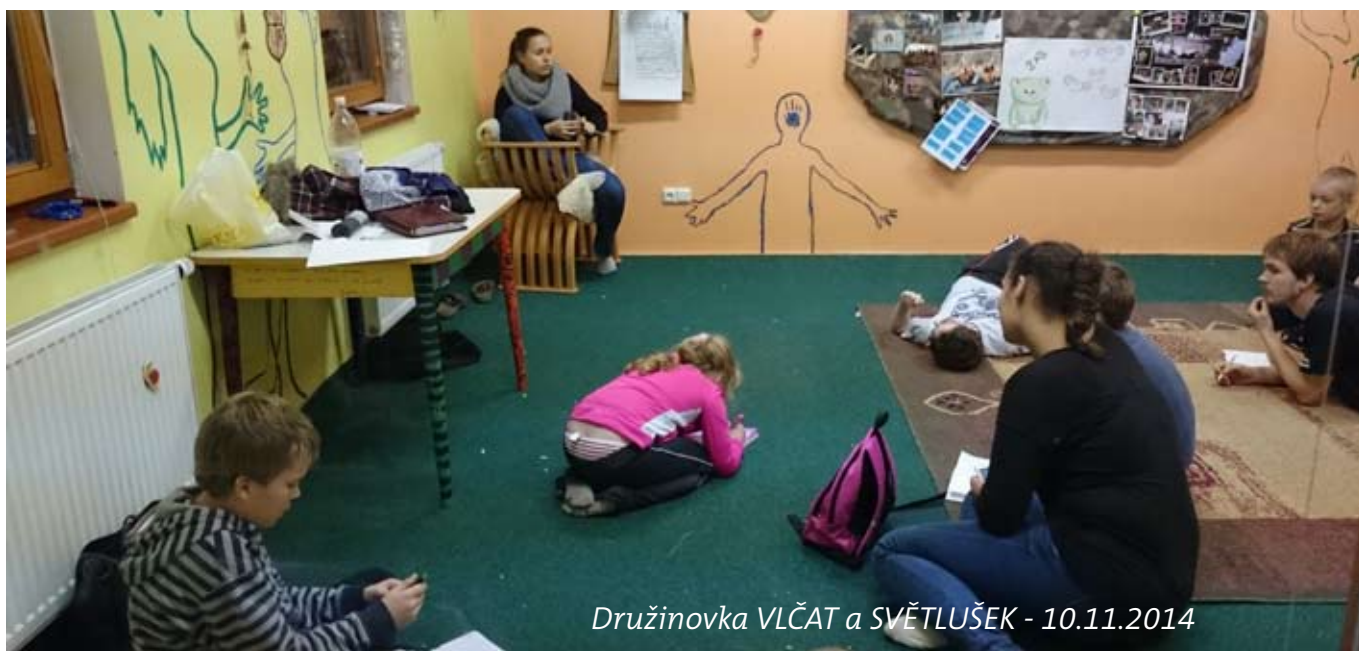
Družinovka VLČAT a SVĚTLUŠEK - 10.11.2014

Lidé by byli šťastnější, kdyby o své štěstí neustále neusilovali. - G.Leopardi -